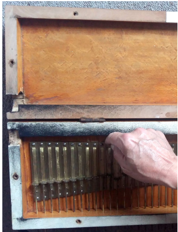
Geöffnete Windlade der Physharmonika. Die an ihrem unteren Ende festgeschraubten, frei schwingenden Zungen werden durch die verschiebbaren Stimmkrücken von beiden Seiten fixiert. Mit dem nach unten aus der Lade führenden Draht werden die Krücken verschoben, was die Tonhöhe verändert.