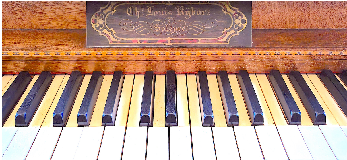
Mittlere zwei Oktaven der Manualtastatur und Firmenschild: «Ch. s Louis Kyburz à Soleure»