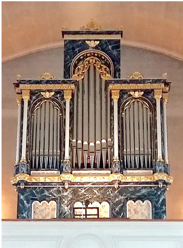
Der Orgelspropekt heute