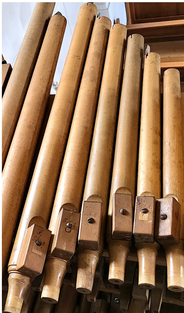
Im Diskant hat die Floete 8' überbläsende, gedrechselte Holzpfeifen. Der Windkanal führt durch den aufgeschraubten Vorschlag, so dass die Oberkante des (hier nicht sichtbaren) runden Lochs wie bei einer «richtigen» Querflöte von aussen angeblasen wird.