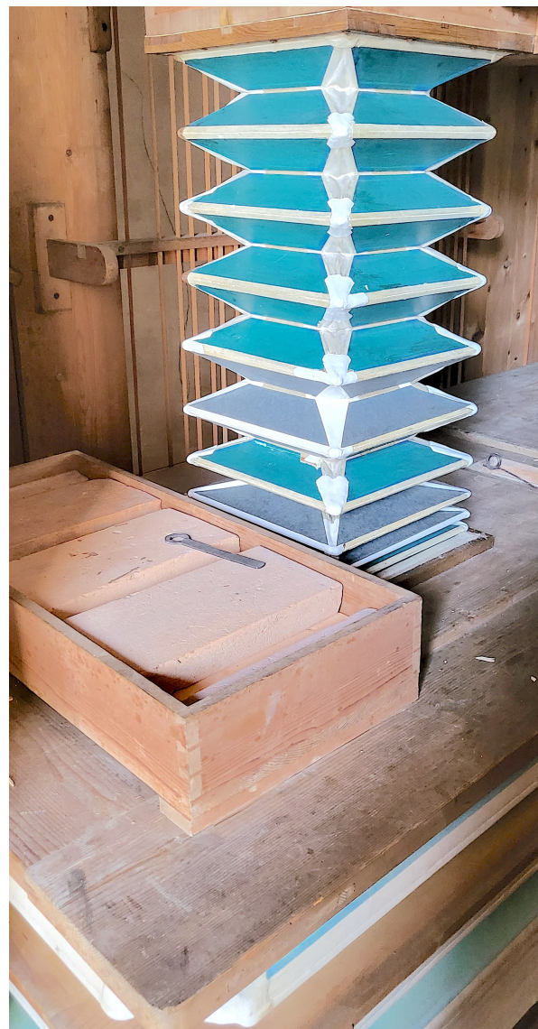
Das Gebläse. Ein sogenannter „Handorgelbalg“ führt den Wind vom Magazin zur Windlade.